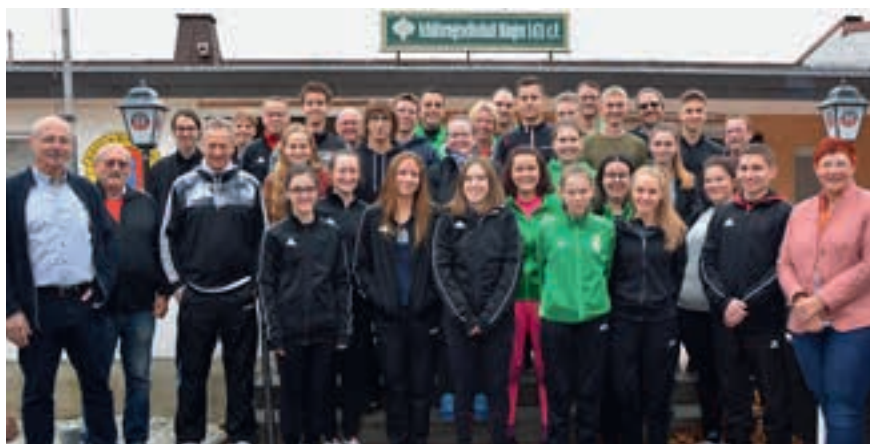
Die Teilnehmer des gemeinsamen Trainings.

Der Schwerpunkt im Gewehrbereich waren die Themen Zielen und Abziehen. Zum Ende des Tages wurde dann ein Wettkampf-Training durchgeführt. Je ein Teilnehmer aus dem PSSB und RSB-Gebiet Süd bildeten eine Mannschaft. Die ersten drei Plätze erhielten kleine Preise.