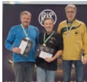
LG-Auflage Senioren A Einzel männlich.