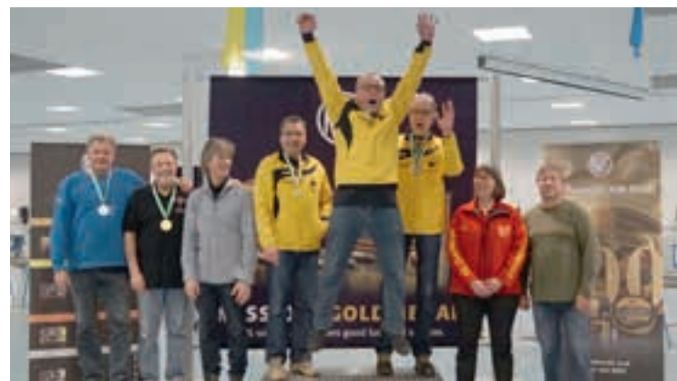
LG-Auflage Senioren A Mannschaft.