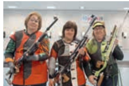
LG-Auflage Senioren A Einzel weiblich.