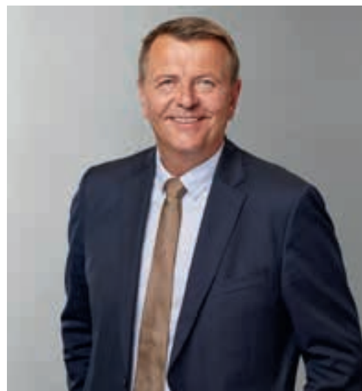
Christoph Rasche, MdL, FDP-Fraktionsvorsitzender im NRW-Landtag.