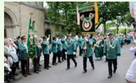
Schützenumzug in Köln-Deutz.