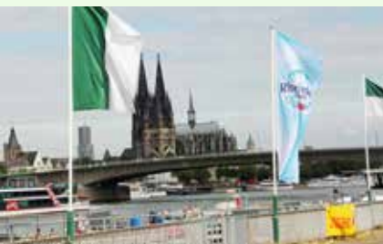
Mit dabei an diesen drei Tagen auch unsere Werbeträger Sinalco und Rheinfels- quellen.