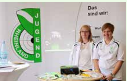
Und auch die Jugend stand bereit.