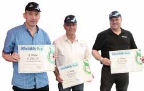
Die Erstplatzierten des Rheinfels Cups.

Der Sonntag stand schließlich im Zeichen der Wettbewerbe des Rheinischen Schützenbundes e. V. 1872.