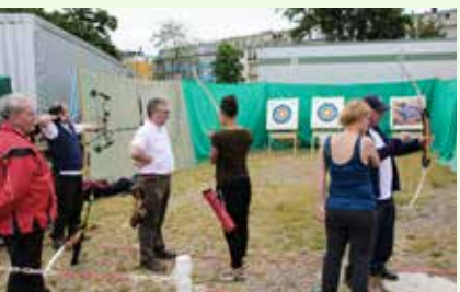
Für die Gäste: Bogenschießen und ...