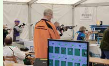
Und auch das Schießen um den Rheinfels-Cup kann nun beginnen.