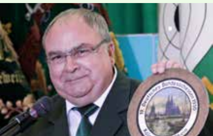
Schon 1939 fand in Köln das damals 19. Bundeskönigsschießen statt.