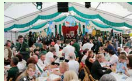
Die Proklamation der neuen Bundesmajestäten beginnt.